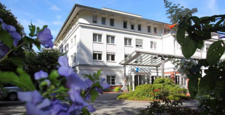
Die Celenus Fachklinik Freiburg